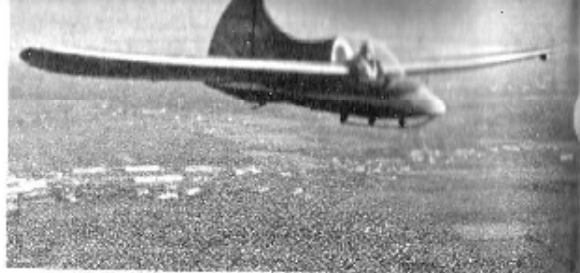
L'aérovoilier de G. Briffaud, avion et planeur, est équipé d'un moteur Volkswagen de 24 chevaux.