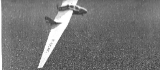
Ce planeur sans queue est l'aile volante Fauvel AV 45. Il est muni d'un moteur 4 cylindres, 2 temps.