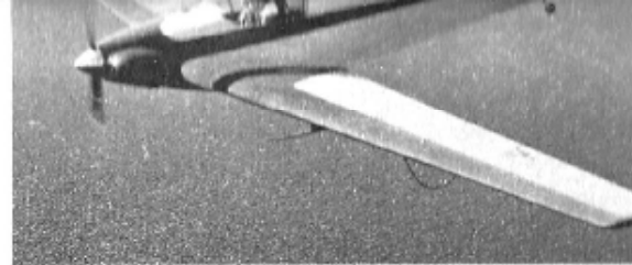
L'avion planeur Fournier monoplace à faible puissance permet voltige, voyages et vol à voile.